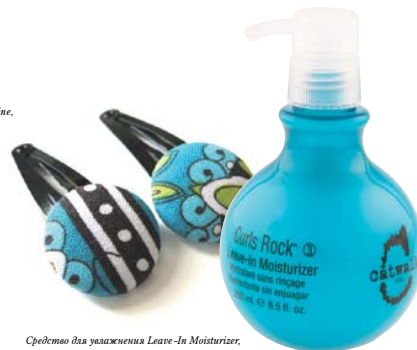
Средство для увлажнения Leave-In Moisturizer , TIGI.

Комплексным подходом к проблеме вьющихся волос также отличается TIGI. В «кучeryаую» линию Curly Rock входят шампунь, кондиционер, средство для увлажнения Leave-In Moisturizer, спрей Curl Booster, крем Curl Amplifier и лак-спрей. Приятное и полезное дополнение к серии – средство для усиления завитка Uptight.