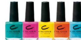
Рекомендованные продукты: все оттенки весенней коллекции Dolled Up и Glam Queen (даже для перекрытия лунки ногтя)