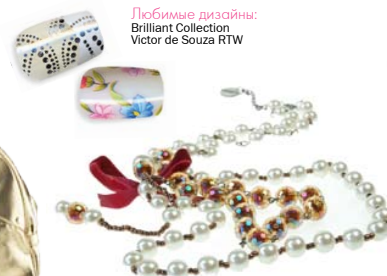
Любимые дизайны: Brilliant Collection Victor de Souza RTW

Прозрачные драпировки, пастельные или насыщенные тона, струящийся шифон... Подходящая вечерняя длина, гладкая прическа и смелый ошеломляющий выход в «поблекший» свет. В этом сезоне дизайнеры предложили свежие молодые цвета, идеальные силуэты и много легких и блестящих тканей. Акцент — кукольные платья с бантами от Valentino и, как всегда, соблазнительные, открытые, платья в пол от Roberto Cavalli.