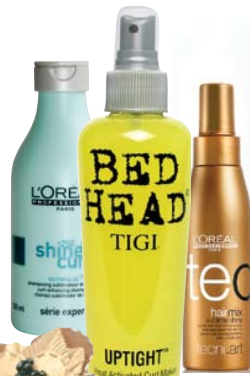
Шампунь для красоты локонов Curly-enhancing Shampoo , L'Oréal Professionnel. Средство для усиления завитка Uptight , TIGI. Сыворотка для сухих вьющихся волос Sublime Shine , L'Oréal Professionnel.

Учитывая особенности вьющихся волос, фирмы-производители разработали специальные средства для ухода и стайлинга. L'Oréal Professionnel разработал целую линию продуктов «для кучeryашек» с говорящим названием Shine Curl («Сияющий локон»): сюда входят шампунь, молочко-кондиционер, маска-питание и спрей-уход. Все средства содержат керамиды, экстракт виноградных косточек, и специально разработанный запатентованный активный компонент для тонуса завитков, блеска и четких линий.