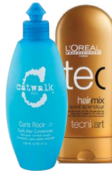
Кондиционер Curly Hair Conditioner , TIGI. Крем для подчеркивания и питания локонов Spiral Splendor , L'Oréal Professionnel.

Scissors объясняет, почему вьющиеся волосы зачастую представляют проблему, а также предлагает обзор средств по исправлению «кучeryаых» недостатков.